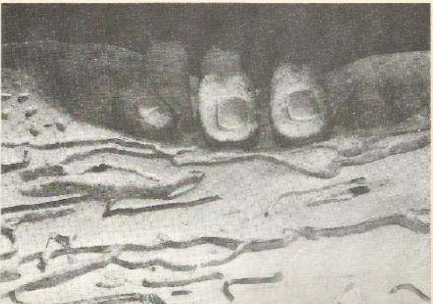
Odette Cuevas (cat. 44)